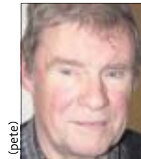
„Die Bezirksvertretung ist das Wichtigste für unsere Interessen. Da müssen wir einfach vertreten sein.“