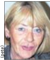
„Hier nimmt die Ortsunion und auch Kirchlnde selbst Schaden.“