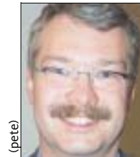
„Hier wurde gute Arbeit ehemaliger und derzeitiger Mitglieder der CDU mit Füßen getreten.“